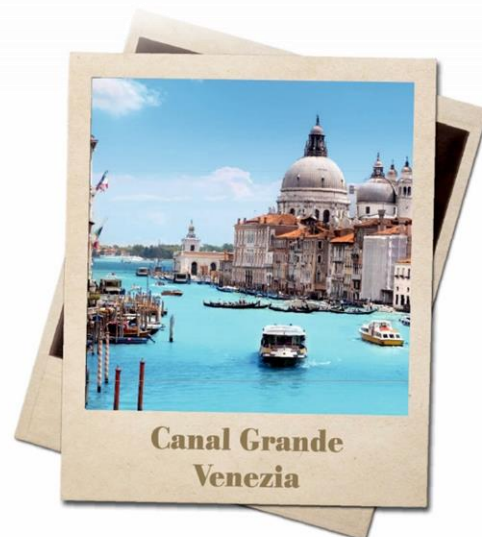
Canal Grande Venezia

"Coi bastoncini a Venezia? Vi sembra strano? Non per noi di NOSTRA ITALIA , gli specialisti delle proposte un po' alternative... Venezia non è solo Piazza S. Marco e una foto coi piccioni: fare sport tra calli e campielli - anche per chi non se la sente di partecipare alla più impegnativa " Venice Marathon " - è un modo salutare di godersi i tesori nascosti di questa città. Quindi