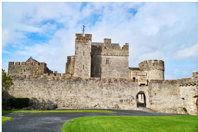
Castello di Cahir

Trasferimento dalla propria località all'aeroporto di partenza/rientro in Italia - Eventuali adeguamenti carburante - Cene del 1° e 7°giorno - Pranzi (su richiesta) - Bevande, se non quelle indicate - Ingressi (da pagarsi in loco) se non quelli indicati ne la quota comprende - Mance - Facchinaggio - Assicurazione Annullamento - Extra di carattere personale e tutto quanto non indicato ne la quota comprende.