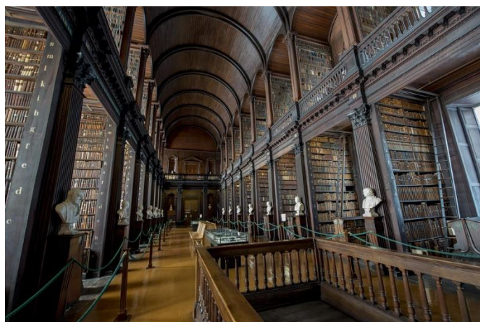
Dublino – Trinity College